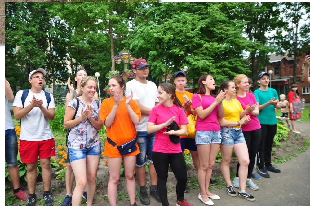
«Кашин-квест» в Кашине