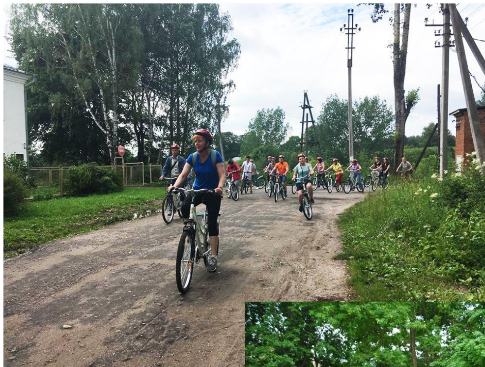
туристический веломаршрут «Колесим по городу» В Тутаеве